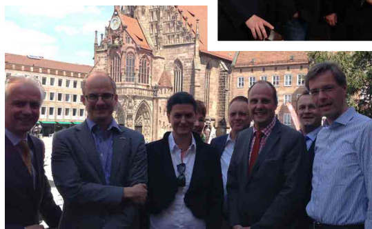
der kommunikative Austausch mit den Wirtschaftsjunioren während des Mittagessens wird von allen Gesprächsgästen sehr geschätzt.