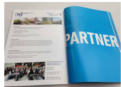
Gelebte Medienpartnerschaft mit dem Ludwig-Erhard-Symposium

Last but not least gab und gibt es für engagierte Mitglieder der WJN auch die Möglichkeit, für beide Events Karten aus unserem begrenzten Kontingent zu erhalten. Weiterhin haben wir uns im vergangenen Jahr erstmals mit dem Lionsclub Nürnberg-Franken sowie deren Nachwuchsorganisation „Leos“ in einen Austausch begeben. Was zuerst als „vorsichtiges Beschnuppern“ auf