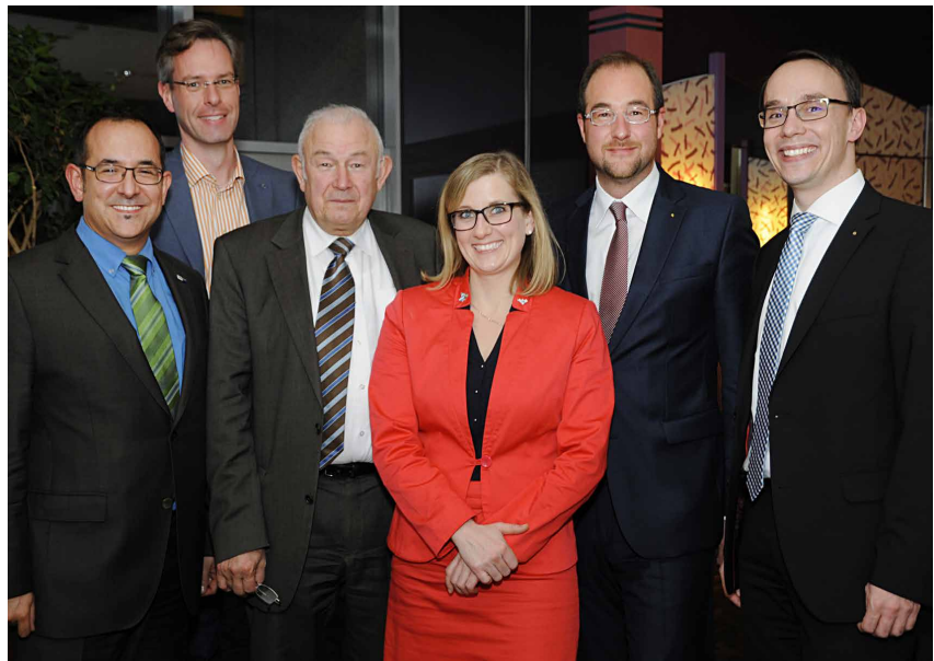
Vorstand und Moderatoren des Abends mit Dr. Günter Beckstein