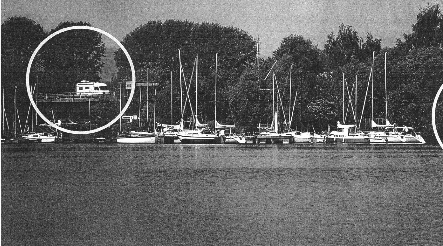
Die Trasse der A 7 liegt nur 60 Meter vom NSC-Clubhaus entfernt ...