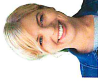
Katharina Schulze MdL, Fraktionsvorsitzende Bündnis 90 / Die Grünen München